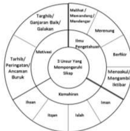
Rajah 4: Hasil Dapatan Kajian

Unsur ‘ilmu pengetahuan’ adalah perkara pertama yang perlu ditanamkan dalam diri seseorang dalam usaha pembentukan sesuatu sikap atau kebiasaan. Unsur ini diperolehi dengan melihat, memandang, mendengar, merenung, berfikir dan menaakul untuk mengambil pengajaran. Seterusnya seseorang perlu diberikan kemahiran untuk mengamalkan sesuatu kebiasaan yang baik itu. Kemahiran untuk mengamalkan kebiasaan yang baik ini dapat diterapkan oleh pendidik dengan memberikan contoh yang baik kepada anak didik mereka dengan menerapkan nilai-nilai keimanan, menyuburkan sifat islah (pembaikan diri), profesionalisma (itqan) dan kesempurnaan (ihسان) dalam diri individu.