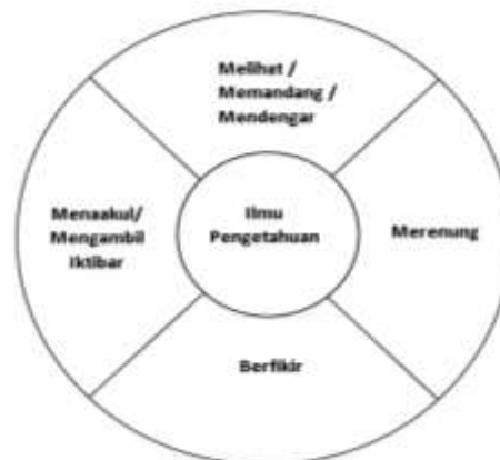
Rajah 1: Pencerapan Ilmu Pengetahuan Oleh Individu