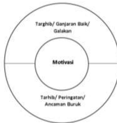
Rajah 3: Pembentukan Motivasi Oleh Individu

Menurut Ibrahim Hamd al-Quayyid (T.t) setelah manusia berhasil dalam mencari ilmu pengetahuan dan mempunyai kemampuan untuk melakukannya maka ia diteruskan pula dengan membangkitkan motivasi atau keinginan untuk melakukannya. Ini kerana seseorang yang bermotivasi akan sentiasa majukan diri dalam pekerjaannya dan menjauhi sifat malas seterusnya dengan motivasi tersebut akan membuatkan mereka naik pangkat ataupun berada pada posisi yang lebih baik dari sebelumnya. Ia juga seimbang di antara dunia dan akhirat serta seimbang antara keperluan peribadi dengan keperluan sosial sehingga masyarakat juga dapat menerima seseorang itu dengan baik di atas kejayaannya. Ini juga seiring dengan cara yang Islam gunakan dalam memberi motivasi kepada manusia iaitu melalui cara targhib wa tarhib ataupun melalui galakan dan ancaman. Ini sebagaimana berikut: