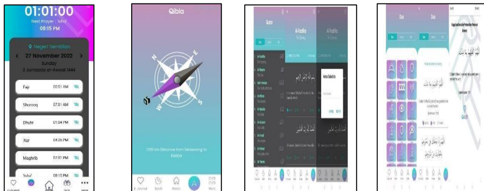
Rajah 2: Aplikasi Qalby

Aplikasi Qalby juga merupakan aplikasi yang tidak kurang hebatnya dengan aplikasi TheNoor. Aplikasi ini juga mempunyai kemudahan dan keistimewaan kepada pengguna untuk mengakses waktu solat dengan mudah menerusi paparan teks yang senang difahami dan waktu solat itu diambil terus dari JAKIM. Selain itu, Aplikasi ini juga menyediakan himpunan doa harian dan pilihan ayat suci alQuran untuk pengguna. Terdapat dua fungsi menarik di bawahnya yang dikenali Hifz dan Saved . Menerusi ciri Hifz , pengguna boleh menetapkan pilihan doa atau surah yang ingin dihafal. Seterusnya, fungsi Saved pula untuk memudahkan pengguna menyimpan doa atau surah yang ingin dijadikan sebagai rujukan. Bacaan Al-Quran juga disertakan dengan terjemahan serta audio untuk bacaan yang betul.