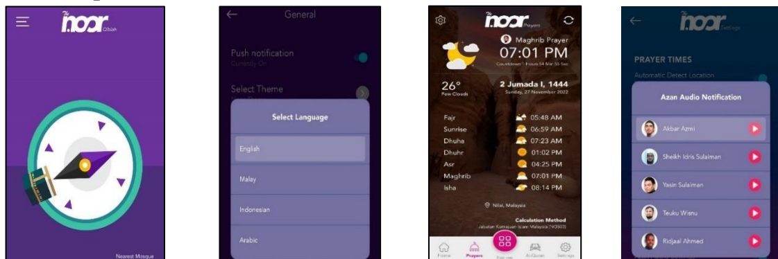
Rajah 1: Aplikasi TheNoor: Azan, Quran, Qiblah

Antara kemudahan yang disediakan dalam aplikasi The Noor adalah mendengar dan membaca al-Quran, mencari arah kiblat, melihat waktu solat di mana ini adalah fungsi utama untuk semua pengguna berasa selesa dan mudah. Selain itu, aplikasi ini mempunyai tujuh pilihan bahasa terjemahan iaitu Melayu, Indonesia, Inggeris, Tamil, Turki, Arab dan Mandarin yang dirujuk daripada terjemahan Mujammah Malik Fadh (Arab Saudi) sebagai rujukan yang sah dan berwibawa.