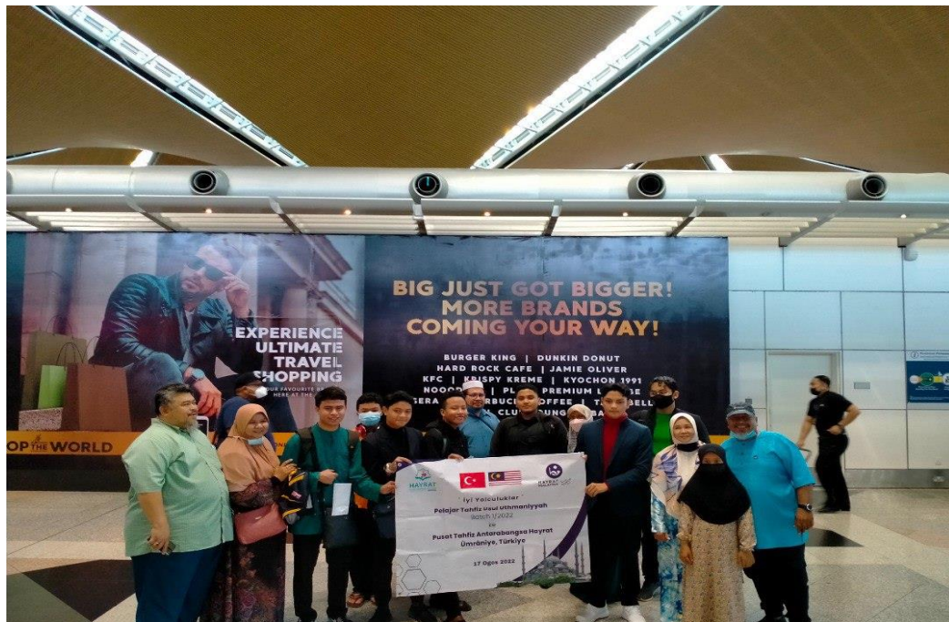
Pelajar Pusat Tahfiz Antarabangsa Hayrat Malaysia Bergerak Ke Turkiye