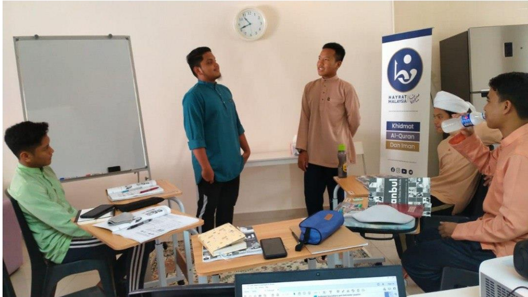
Pelajar Pusat Tahfiz Antarabangsa Hayrat Malaysia di Nilai Spring Villas, Nilai.