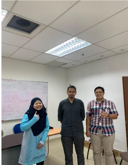
Temu Ramah Bersama Pegawai Pendidikan Hayrat Malaysia