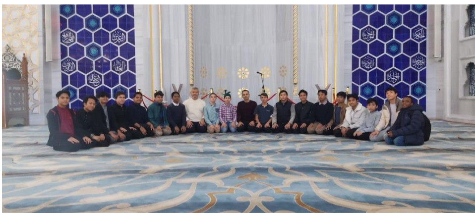
Pelajar Pusat Tahfiz Antarabangsa Hayrat Malaysia di Turkiye